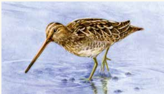
Enkelbeckasinen trivs i vattnet i Hökälla. Illustration: Agnes Danielsson

i området. I dammarna finns det gott om fisk som gädda, mört, björkna, brax och ål. Här har också de mycket sällsynta vattenväxterna knöl- och spetsnate planterats in.