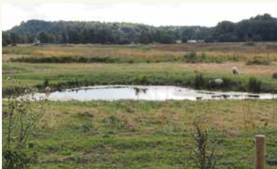
I området runt våtmarksparken betar får.

Runt våtmarksparken går ett 3, 5 kilometer långt motionsspår, med belysning nästan hela vägen. Från gångvägarna kan mycket av fågel- och djurlivet observeras. Fågeltornet vid Håberget ger god utsikt över området. Grillplatsen är öppen för allmänheten och här finns ved för eldning. Sittbänkar finns på flera ställen i parken.